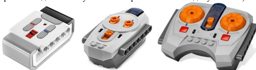
Рисунок 2 «Общий вид конфигурации полигона»