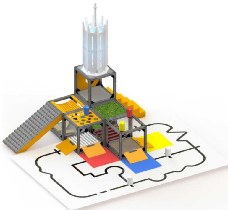
Рисунок 1 «Общий вид конфигурации полигона»