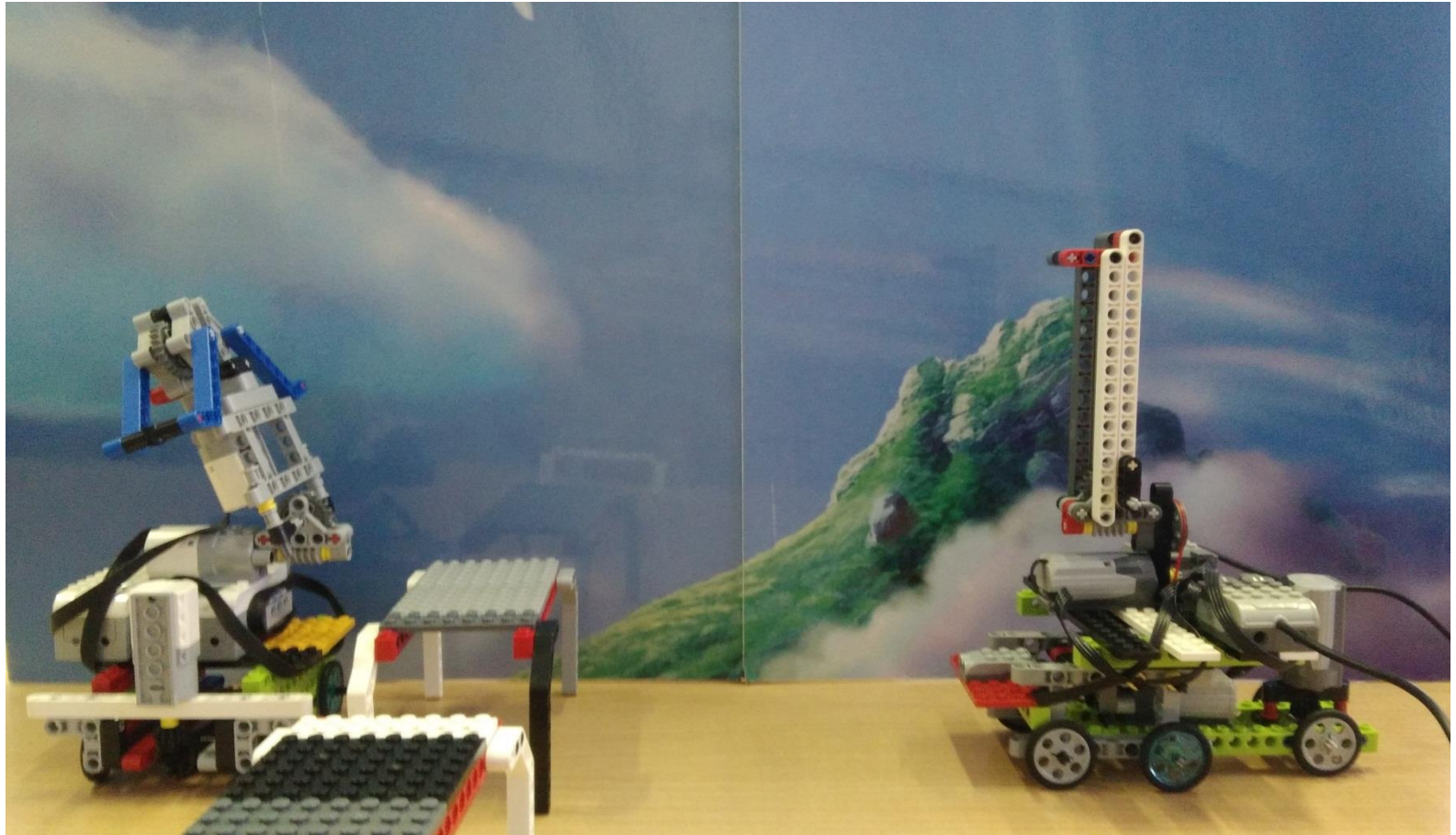
Автономные транспортные средства для склада