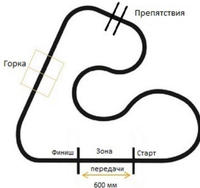
Рис. 1. Пример поля