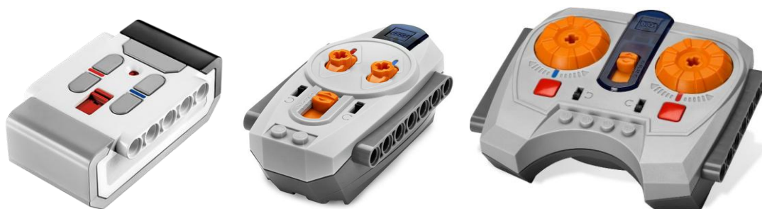
Рисунок 2 «Примеры распространенных ИК-пультов»