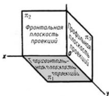
Рис. 1. Наименование плоскостей

Конструкция робота не должна позволять захватывать мяч. Захватом мяча считается перекрытие более 50% мяча проекцией робота в горизонтальной или профильной плоскости проекции с обеих сторон в любой момент времени.